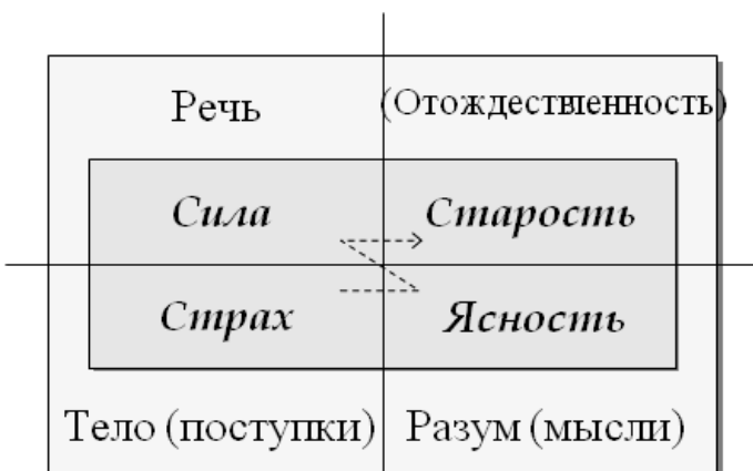
Рис. 30 Враги человека на пути Кармические двери действия