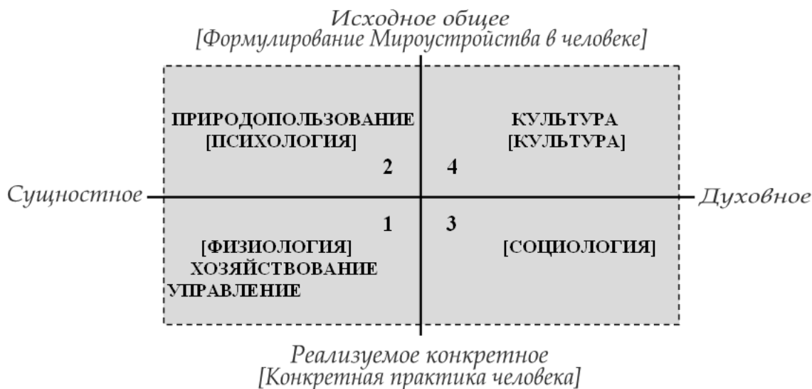
Рис.43 Аспекты Экософии [Составные части антропологии]