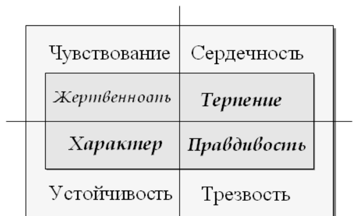
Рис. 31 4 колеса колесницы в пути 4 атрибута воина

Мы уже определили раньше 4 вида внимания и радости человека, проявленные как адекватность миру. Из буддизма известны четыре вида применения (направления) внимательности (рис.32) (К слову, определяющее свойство интеллигентности - внимание к смыслу.)