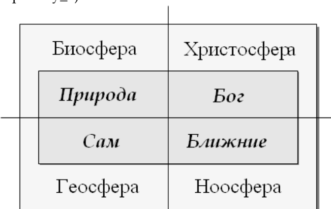
Рис. 35 Взаимосвязи целостного человека Стадии эволюции человечества < по де Шардену >