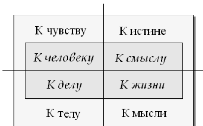
Рис. 32 Виды внимания Внимательность

С инстинктами взаимосвязаны исходные потребности и экзистенциальные блага человека (см. начало главы).