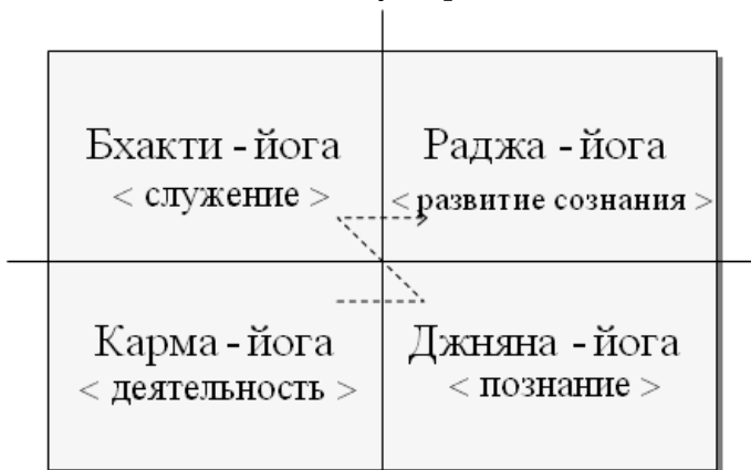
Рис. 28 Пути развития

В каждую эпоху есть путь, наиболее соответствующий состоянию общественного сознания. Ошо и Саи Баба утверждают, что сейчас это путь Бхакти, путь, начинающийся от сердца.