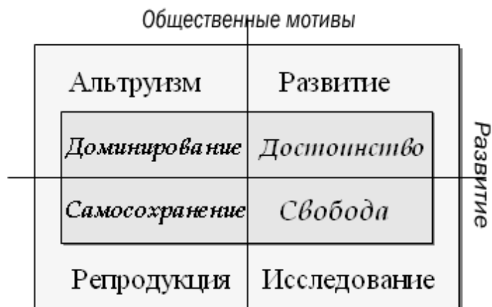
Рис. 33 "Статические" инстинкты < сохранения > "Динамические" инстинкты < развития >

Сравните обязательно левые кадры с результирующими квадратами рис.08 (повернув их против часовой стрелки на 90°) и с квадратом рис.16.