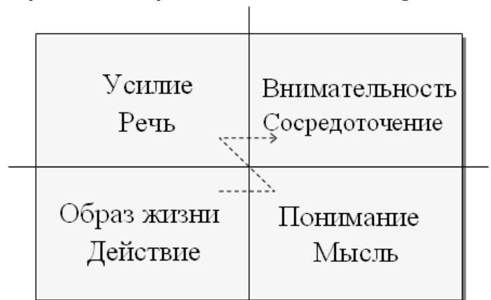
Рис. 29 8 - ричный путь