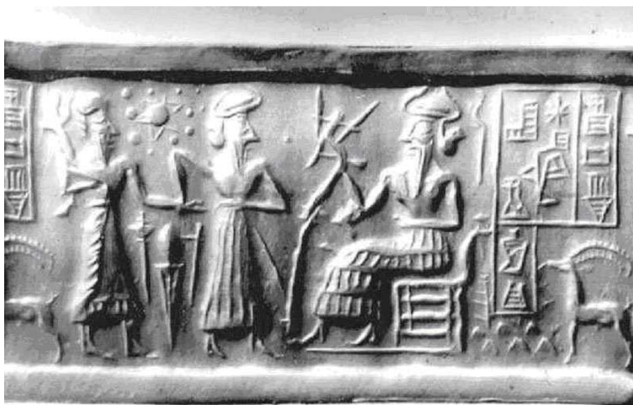
Изображение шестиконечной звезды на шумерской печати.

Сама эта звезда известна еще по артефактам из культур раннего матриархата и, согласно американскому психологу Вильгельму Райху (Wilhelm Reich), является одним из древнейших магических символов и означала природный чин оплодотворения между мужским и женским началами и между небом и землей. Шестиконечная звезда сопровождала некоторые шумерские изображения табличек и печатей.