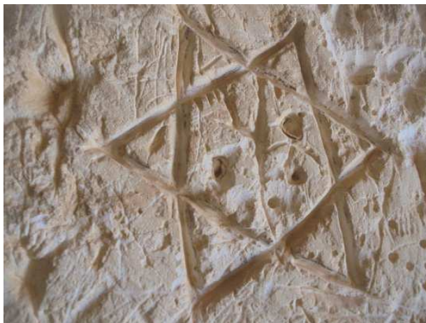
Фотография шестиконечной звезды на стене пещеры.

Сама эта звезда известна еще по артефактам из культур раннего матриархата и, согласно американскому психологу Вильгельму Райху (Wilhelm Reich), является одним из древнейших магических символов и означала природный чин оплодотворения между мужским и женским началами и между небом и землей. Шестиконечная звезда сопровождала некоторые шумерские изображения табличек и печатей.