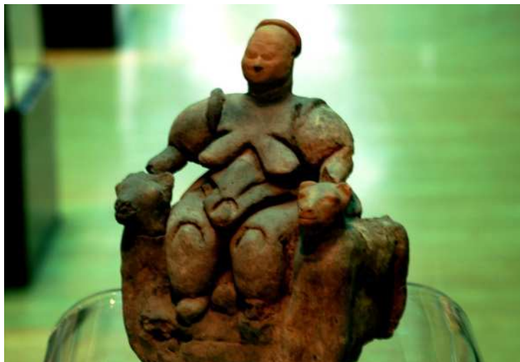
Фигура Великой богини из Чатал-Хююка.

Возраст поселения был определен радиоуглеродным методом в 6200 г. До Р.Х. Хотя сам Джеймс Меллаарт был связан с рядом скандалов о подделке артефактов (вспыхнувших после его смерти и так и недоказанных), тем не менее сам факт нахождения древней цивилизации в Чатал Хююке и Хаджиларе никто не опроверг. Данная цивилизация, согласно мнению современных археологов, существовала между 7400 – 5600 годами до Р.Х. и знала использование меди и золота, как и имела письменность.