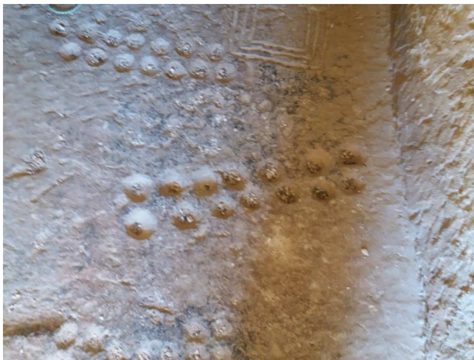
Повторяющиеся изображения семи планет на полу второго этажа храма в горе Эль-Байда.

Что касается петроглифов, то Елена Миронова описала их в нашей совместной статье "Древняя пещера с петроглифами найдена под Пальмирой. Пещера Эль-Абьяд заполнена загадочными петроглифами" [4]. В данном случае следует обратить внимание на знаки семи планет, как и на изображение шестиконечной звезды.