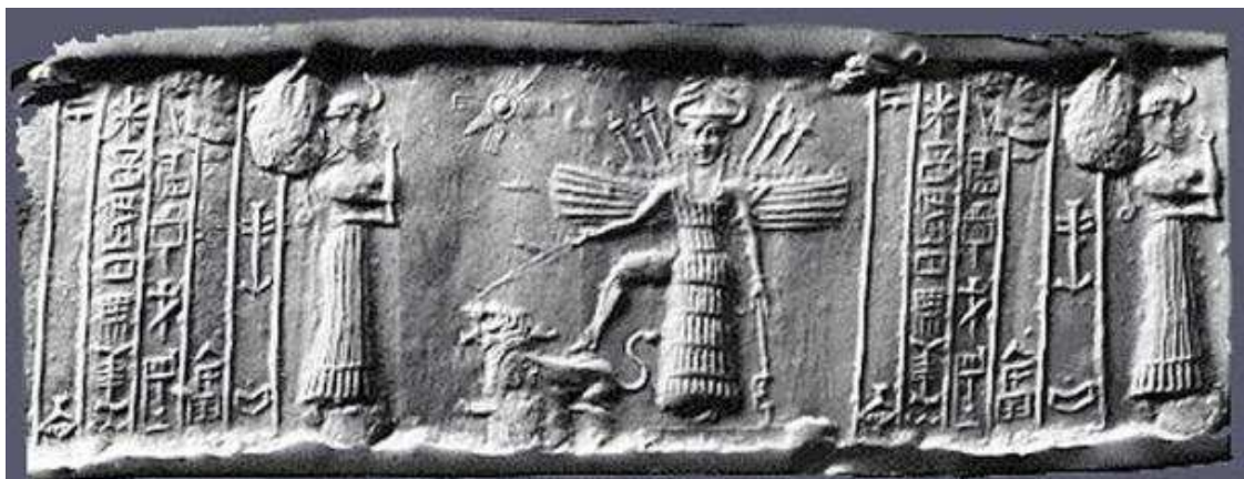
Цилиндрическая печать VA243. Сайт Kowcheg.net

шумеры под Нибиру, как и под другими именами богов, понимали в первую очередь астральные тела, имеющие оккультное значение и, соответственно, связь с ними понимали через магический ритуал.