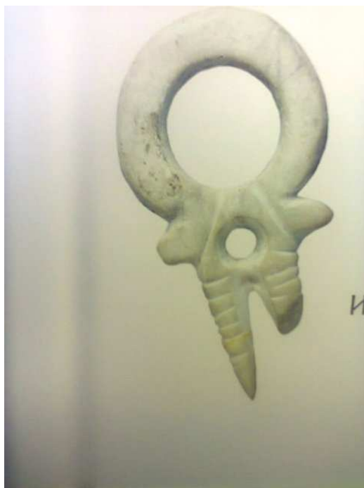
Артефакт из экспозиции музея Лепенский Вир.

по 5500 г. до Р.Х., с тем, что были найдены и более ранние артефакты периода Протолепенского Вира с 8500-по 7500 г. до Р.Х.