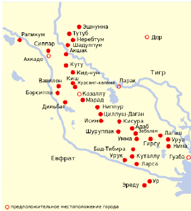
Шумерские города Древней Месопотамии.

Поселение культуры Эль Обейды (Эль Убейды) Эриду датируется некоторыми археологами 5400 годом до Р.Х., тогда как сама культура Эль Обейды (Эль Убейды) датируется 6500 – 3200 до Р.Х., и за ней следует ранний Урук (4000 – 3200 до Р.Х.), являвшийся уже сменённым, в свою очередь, кратковременной культурой Джемдет-Наср (около 3200-2900 г до Р.Х.) называемой еще Урук Три. Инанна была известна у шумеров приблизительно с 3500 года до Р.Х. на основании сохранившихся у них сказаний, известных археологам и историкам [2]. Инанна, которую шумеры называли еще „утренней звездой“, позже была известна как ассирийская Иштар, хананейская Астарта, Карфагенская Танит, угаритская Анат и возможно гэльская Дану, и могла быть наследницей Великой матери, чей культ, в силу разгрома Аратты, должен был видоизмениться в новые культы. В данном случае интересен храмовый комплекс, найденный в горном хребте Эль-Абьяд в пещере в горе Дар Эль Байда под городом Пальмирой, к северо-востоку от него. На стенах помещения, находящегося на втором этаже, обнаружены высеченные в камне многочисленные знаки неизвестного происхождения.