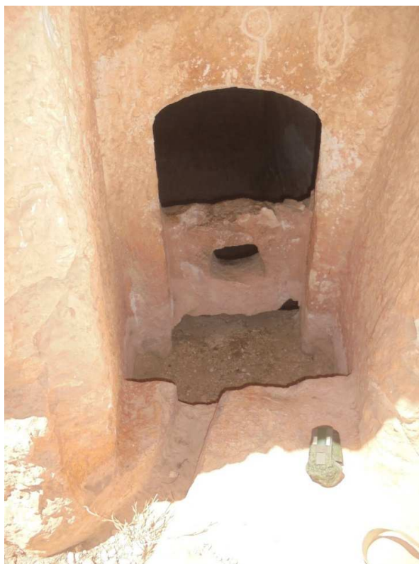
Вид на вход снаружи.

Дверь не симметрична по верхней части обточки, если смотреть снаружи. Свод верхней части двери вписывается в симметрию помещения, если смотреть изнутри.