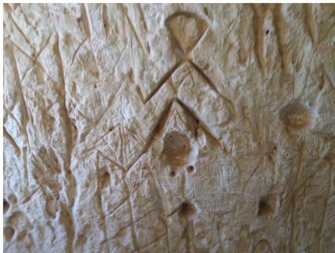
Рисунки(петроглифы) на стене храма в горе Эль-Байда.

Хотя основная масса рисунков (или петроглифов) находится на втором этаже, такие же рисунки имеются и на первом этаже у подъёма в колодец, ведущий на второй этаж. Рисунки нанесены достаточно плотно и иногда накладываются один на другой. Рядом со входом в эту пещеру находится вход в еще одну пещеру, очевидно, искусственного происхождения. Внутри пещера напоминает искусственный водосборник или колодец и имеет полукруглый свод.