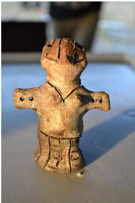
Копия найденной в Винче статуэтки Великой матери.

Однако данной культуре предшествовали Старчевская культура и культура Лепенского вира, которые так же, как и Винча, были обнаружены в Сербии. В 1960-х годах, после решения о строительстве Джердапской ГЭС, Королевский антропологический институт в Лондоне выделил из фонда “Руглес Гатес” средства для археологических исследований района затопления.