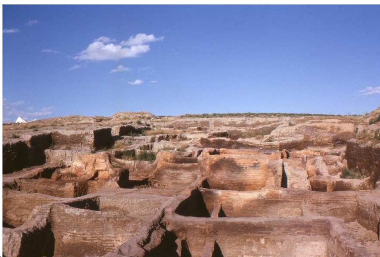
Вид Чатал-Хююка после раскопок Меллаарта.

Возраст поселения был определен радиоуглеродным методом в 6200 г. До Р.Х. Хотя сам Джеймс Меллаарт был связан с рядом скандалов о подделке артефактов (вспыхнувших после его смерти и так и недоказанных), тем не менее сам факт нахождения древней цивилизации в Чатал Хююке и Хаджиларе никто не опроверг. Данная цивилизация, согласно мнению современных археологов, существовала между 7400 – 5600 годами до Р.Х. и знала использование меди и золота, как и имела письменность.