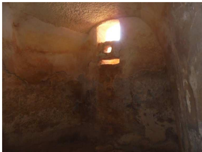
Вид на переборку входа изнутри.

Дверь при этом была не отцентрована и смещена влево, а наверху обточена под мягкую овальную форму.