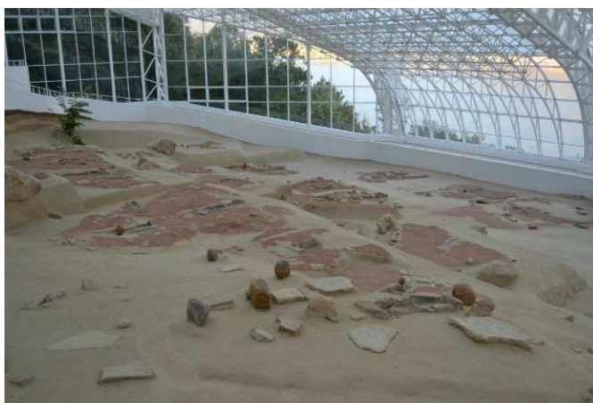
Фотография археологического участка Лепенский Вир, перенесенного в музей.

Однако данной культуре предшествовали Старчевская культура и культура Лепенского вира, которые так же, как и Винча, были обнаружены в Сербии. В 1960-х годах, после решения о строительстве Джердапской ГЭС, Королевский антропологический институт в Лондоне выделил из фонда “Руглес Гатес” средства для археологических исследований района затопления.