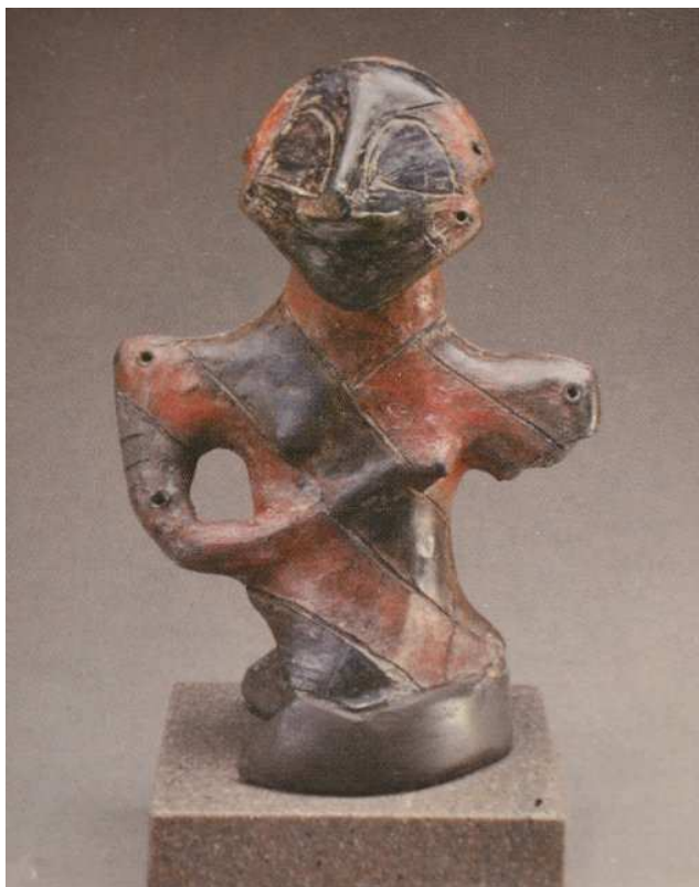
Фото статуэтки Великой матери из Сербии.