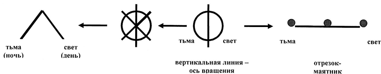
Знаки «Л» — «П»

Вода — тьма, но в толще вод скрыты свет и жар. Море статично, а движение привносится в него извне ветром. Ветер гонит волну. Волна линейна и бесконечна. Змей содержит в своей утробе жар (дракон). Внутренний жар сообщает змею движение. Змей живет в воде, но может передвигаться по суше, тем самым соединяя в себе жар вод и земли. Тело змея подобно лучу, так как имеет начало — кончик хвоста. Змей перемещается линейно, но может свернуться в кольцо. Он символизирует линейное время и вечность. Преобразование линейного змея в кольцо передается последовательностью слов «рок-крок-круг».