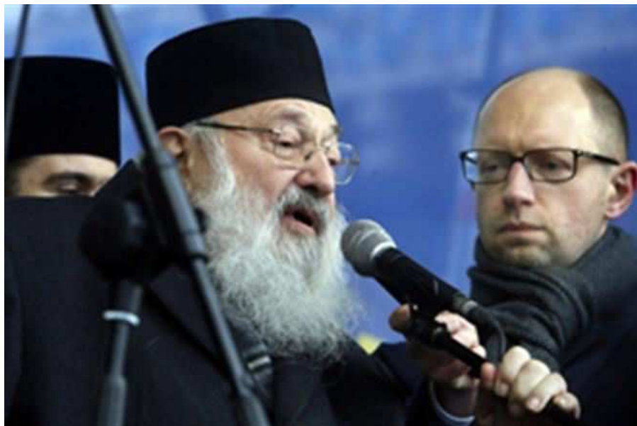
(Киев, экс-глава кардинал УГКЦ Любомир Гузар на Майдане 2014г.)

Когда умирает иерарх какой-либо Церкви, конечно же, ему желают Царства Небесного, возможна даже его канонизация, если он был святым. В связи со смертью экс-главы УГКЦ кардинала Любомира Гузара стоит оценить поступки этого человека, в сравнении с его предшественниками и современниками.