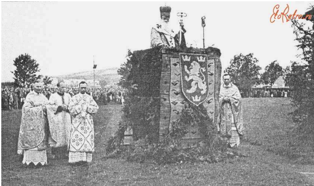
(1943г. Открытое богослужение епископа Иосафата Коциловского для дивизии СС Галичина, за победу Гитлера)

В 1943 епископ Иосафат совершал богослужения для украинцев, служащих в фашистской дивизии СС «Галичина», которые при его полном покровительстве на территории вверенной ему епархии занимались уничтожением поляков, евреев, чехов, украинцев и русских, не разделявших бандеро-фашистские идеалы. В 2001 году он был канонизирован Папой Иоанном Павлом II. Общая русофобия и православнофобия украинских радикалов и Ватикана преодолели у поляка Войтылы память о геноциде более чем 120 тысяч поляков-католиков и позволили причислить к лику святых духовного отца убийц его соотечественников Коциловского.