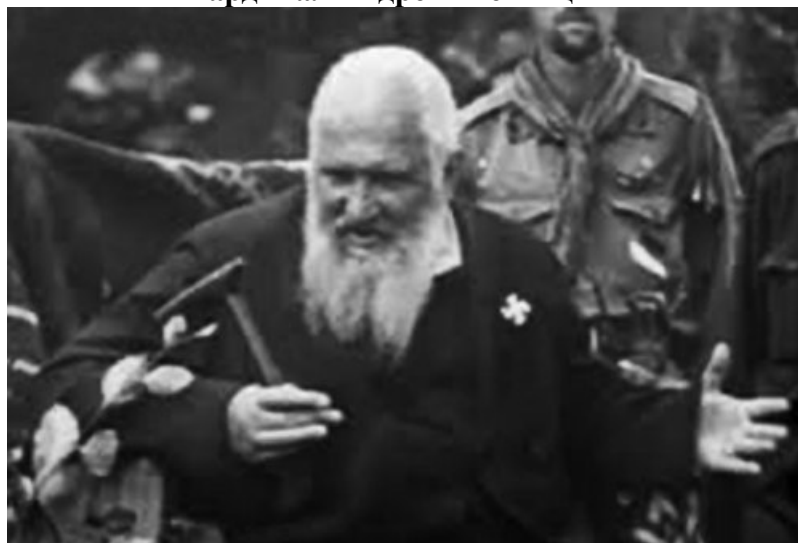
(Глава украинских католиков восточного обряда кардинал Андре Шептицкий с фашистской свастикой)