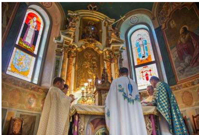
(Свято-Успенский храм УГКЦ с. Козив Тернопольской области, витражные иконы «святых» Андрея Бандеры и епископа Никиты Будки)

Украинская Греко-католическая церковь (УГКЦ) ходатайствует в Ватикане о причислении Бандеры-старшего к лику католических блаженных. Задолго до ожидаемой УГКЦ беатификации (прославления в качестве католического святого) Андрей Бандера стал в Галиции местночтимым святым.