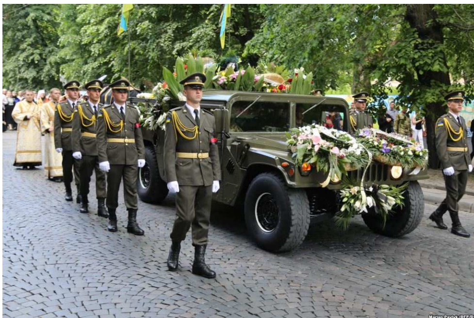
(Мелитаризованные похороны братоубийцы и масона кардинала УГКЦ Любомира Гузара)

Как мы видим на фотографии во Львове прошли мелитаризованные похороны. Глубоко символично, что гражданина США везет не украинский патриотический автомобиль, а военный «Hummer» американской армии, да еще на подставке пушки. Это достойные похороны высокопоставленного члена масонской ложи (ибо так ни когда не хоронили иерархов церковных!), который пользуясь религиозной мотивацией, развязал братоубийственное противостояние на Украине.