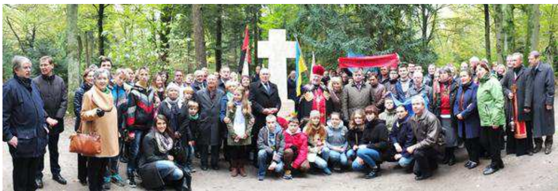
(Мюнхен, кладбище Вальфридхоф, к могиле «святого» Степана Бандеры, паломничество и молитва греко-католиков во главе с епископом!)

Согласно греко-католическим источникам, основания для канонизации Степаны Бандеры были заложены самим лидером ОУН. По словам греко-католического священника из села Козив, «еще при жизни Степан Бандера говорил: «Кому нужна моя помощь, приходите ко мне на могилу, как к живому, расскажите о своих нуждах, и я помогу!» Так гласит одно из «житий» этого еще не канонизированного «святого», где сказано, что его слова сбываются до сих пор. «Больше 50 лет идут и идут настоящие украинцы помолиться на могиле батюшки, служат панихиды, плачут, каются. Тут (у могилы Бандеры на кладбище Вальфридхоф в Мюнхене) царит дух благочестия, святости, благодати».