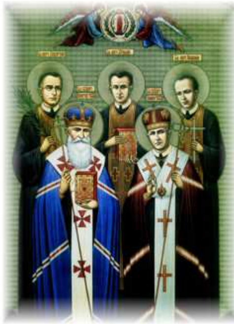
(Икона «святых» в УГКЦ епископы Иосафат Коциловский и Григорий Лакота, сверху ряд, священники Николай Грицеляк, Иван Кузич и Роман Решетило)

Епископа Иосафата Коциловского вместе с шайкой «побратимів» – епископом Григорием Лакотой, священниками Николаем Грицеляком, Иваном Кузичем и Романом Решетило военный трибунал войск МВД Украинского округа осудил на сроки от 4 до 10 лет исправительно-трудовых лагерей. Всем инкриминировали статьи 54-1а (измена Родине) и 54-11 (участие в контрреволюционной организации) УК УССР. Григория Лакоту осудили также по статье 54-4 (оказание помощи международной буржуазии).