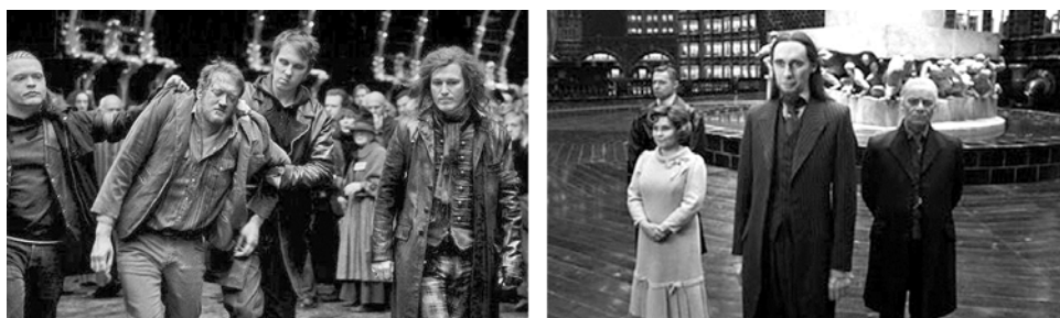
Фашиствующие молодчики «темного лорда» и смена руководства в «Министерстве Магии», которое теперь состоит из «Пожирателей Смерти». Карды из фильма «Гарри Поттер».

Турнир волшебников и Кубок Огня, за который идет борьба между тремя школами магии, можно принять за соперничество европейских элит в битве за энергетические ресурсы, и Лондон, действительно, обеспечил себе убедительную победу в этой битве, потому что вместо политики конфронтации с Москвой создал в центре Сити целый деловой квартал для проживания русскоязычных олигархов, связанных с нефтяной и газовой отраслью. Данное обстоятельство, в самом деле, привело к столкновению интересов США и Англии. Однако до недавнего времени никто в это не верил, никто не воспринимал всерьез политические расхождения среди англосаксов. Точно так же никто в «Министерстве Магии» не верил в то, что Волан-де-Морт вернулся, и что его адепты, озабоченные чистотой крови, начнут наводить во всем мире тоталитарные порядки. Но вот это произошло, и мы наблюдаем за тем, как госсекретарь США и некоторые высокопоставленные чиновники Евросоюза пожимают руки нацистам-бандеровцам. Теперь ни для кого не секрет, что либералы-оборотни, неонацисты и радикалы-исламисты напрямую подчинены Соединенным Штатам Америки и являются креатурой ЦРУ.