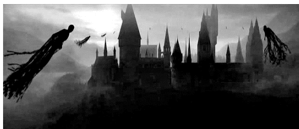
Кадры из кинофильма «Гарри Поттер и Дары Смерти»: клан «Пожирателей Смерти» во главе с темным лордом и дementоры, окружившие школу чародейства и волшебства Хогвартс.