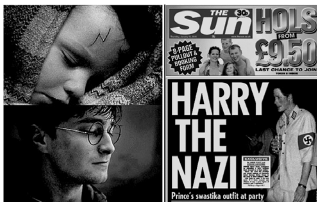
Кадры из кинофильма «Гарри Поттер» со шрамом в виде отраженной руны «Зиг» (заклинание нацистов), который болит всякий раз, когда «темный лорд» (США) провоцирует международную напряженность, и скандально известная фотография на обложке журнала «The Sun» с Принцем Гарри, который для демонстрации своей лояльности Вашингтону пришел на вечеринку в рубашке офицера СС.

Чем англосаксы разнятся, так это долгосрочностью задач, которые перед ними поставлены. Если ЦРУ всегда использовало грязные методы, способствуя уничтожению суверенитета прочих государств, включая все страны Европы и даже Англию, которую держат в узде через ирландское террористическое подполье, то для английской службы разведки приоритетной задачей всегда было сохранение монархии независимо от того, насколько влиятелен англосаксонский мир на том или ином промежутке времени. Если американцы привыкли воевать и устраивать теракты чужими руками, делая это за чужой счет (за счет Германии во время Первой и Второй мировой войны, а сейчас — за счет Саудовской Аравии), то англичане были вынуждены постоянно адаптироваться и достигать цели, используя внешнеполитическое влияние США. Поскольку ЦРУ выполняет в этом тандеме тактические задачи, то моральная дискредитация Соединенных Штатов Америки, их неизбежный дефолт, расчленение и возможный переход обратно под протекторат Великобритании заложены в долгосрочной стратегической линии, которой придерживаются патриотично настроенные джентльмены из Ми-5.