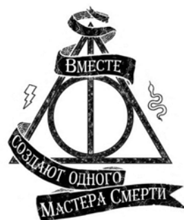
Однодолларовая купюра с масонской печатью на вершине пирамиды, обозначающая тайное мировое правительство, и символ Даров Смерти из палочки и воскрешающего камня, совмещенных внутри плаща-невидимки.