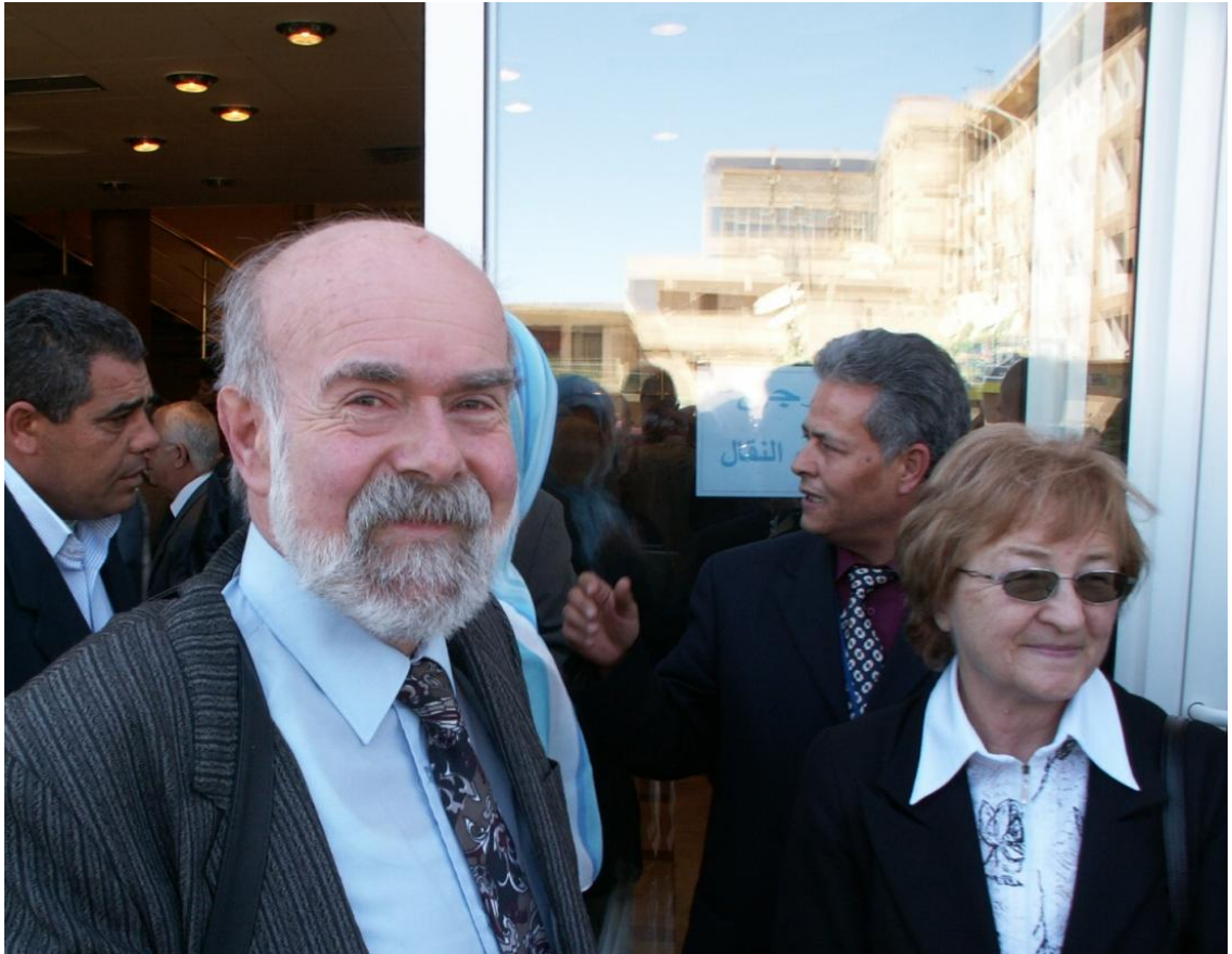
Участники конференции из Польши