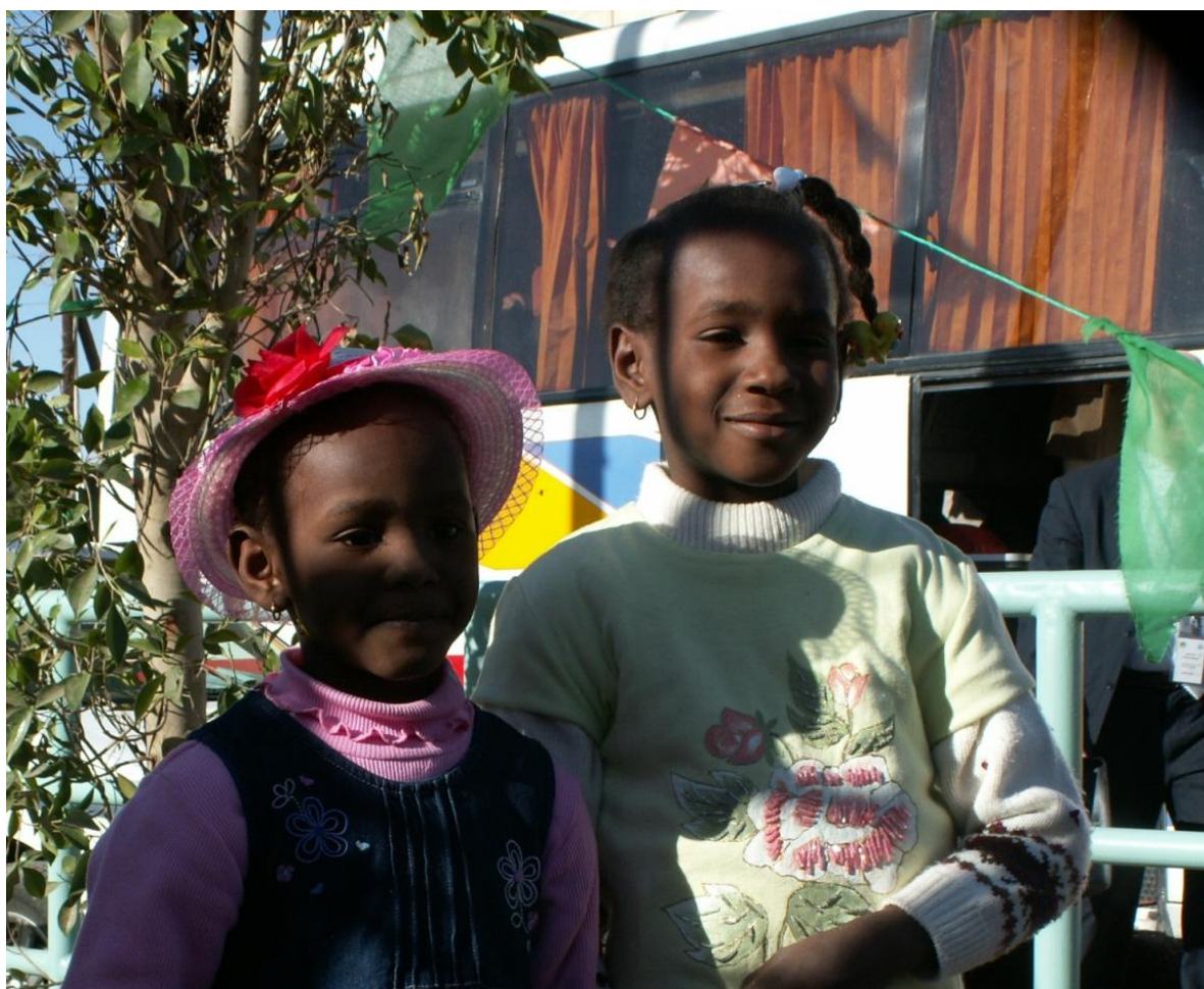
Жители г. Себха