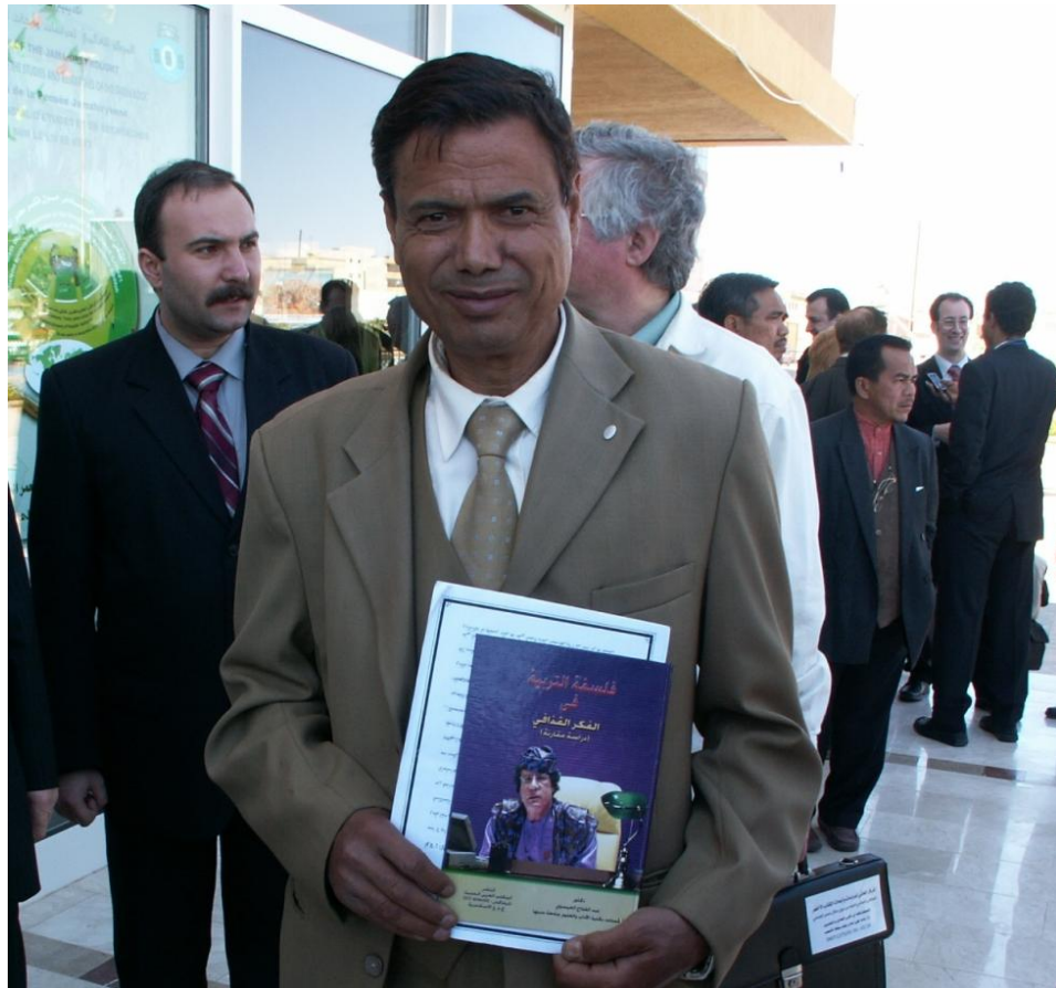
Участник конференции из Латинской Америки