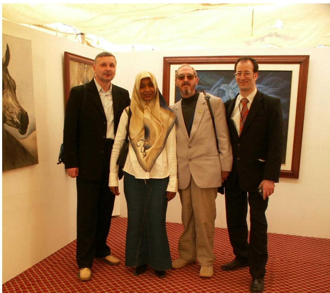
Участники конференции в музее Центра по изучению Зеленой книги