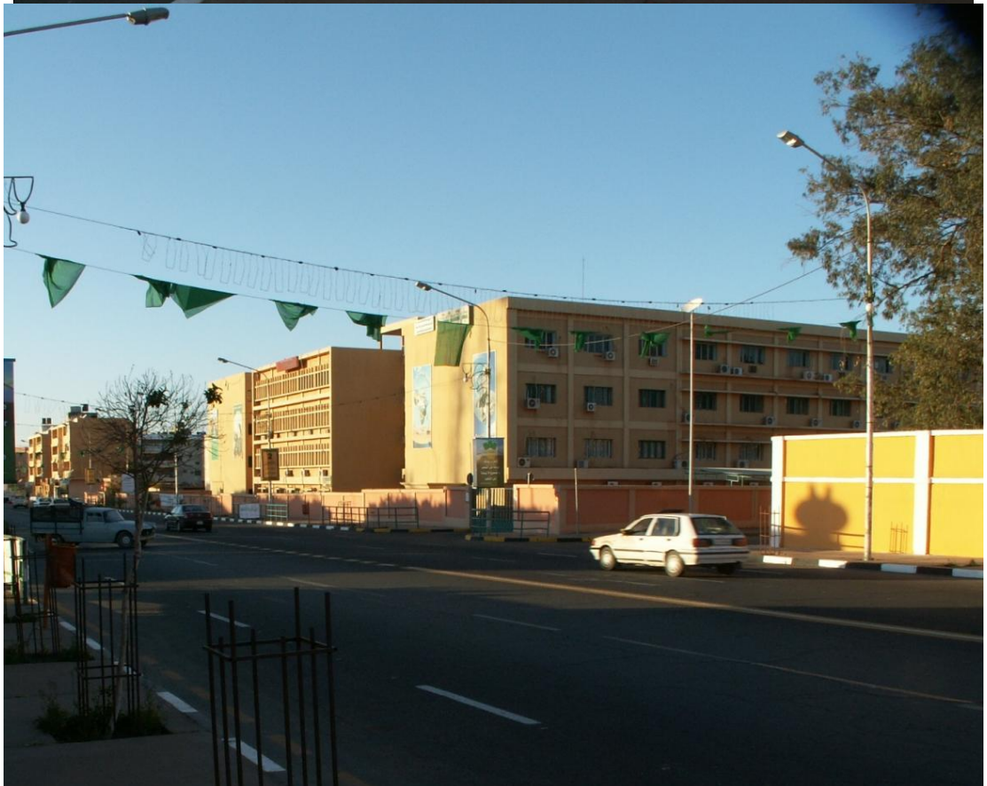
На улицах Сабхи