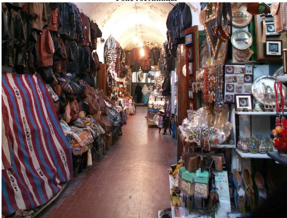
Триполи, восточный базар