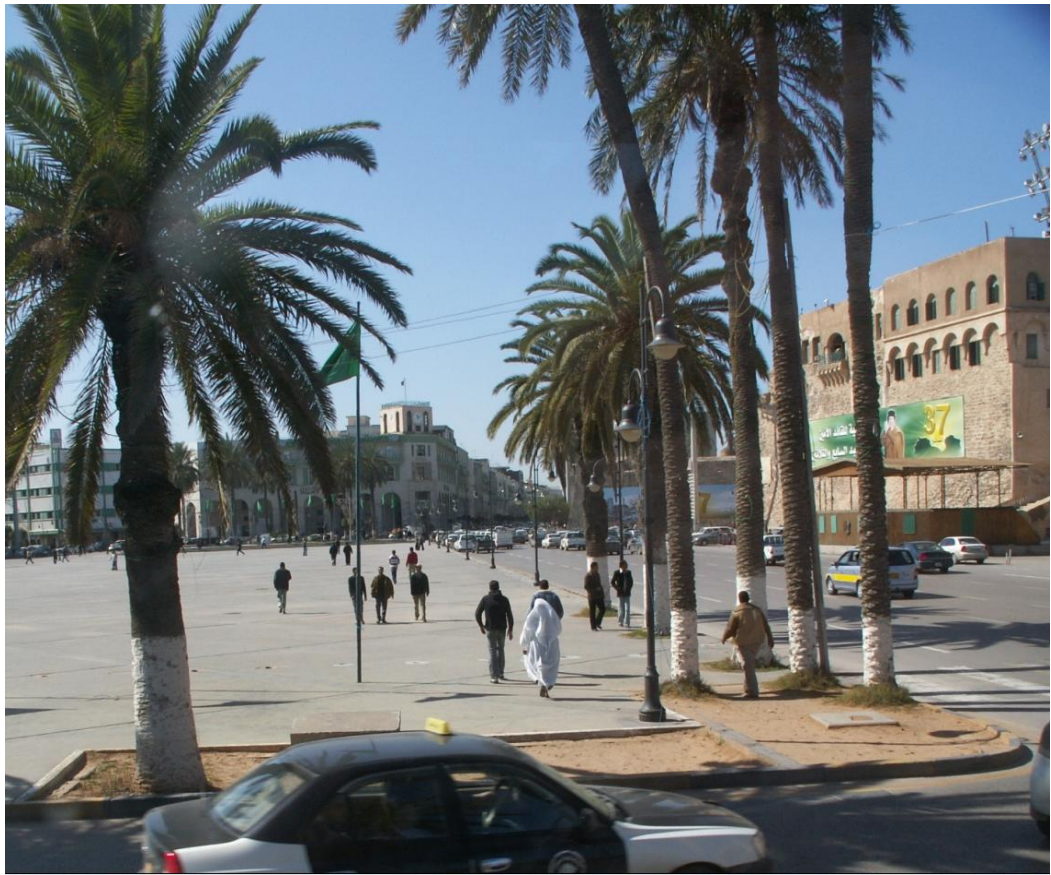
Центральная площадь Триполи