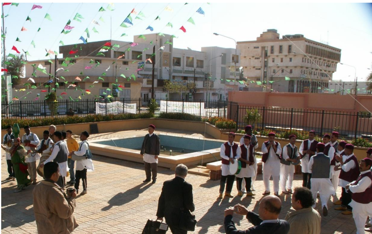
Себха, перед зданием, где проводилась Международная конференция