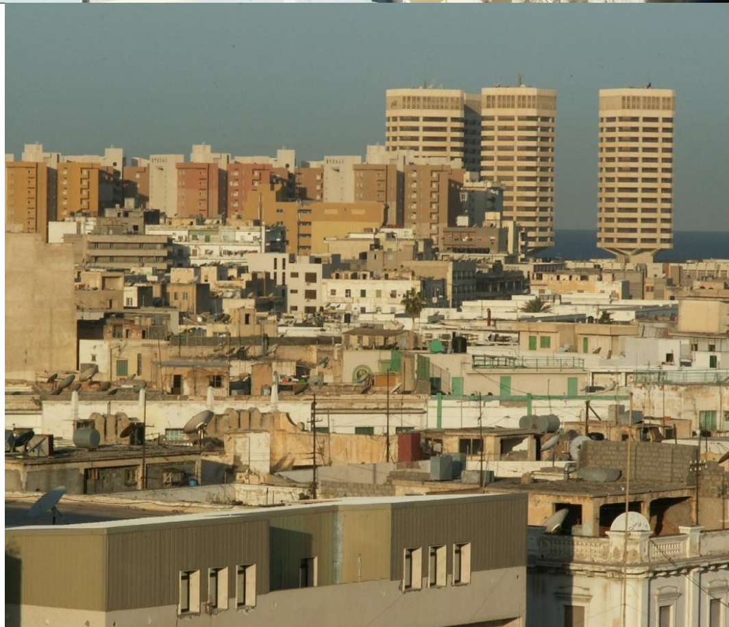
Триполи, панорама из окна гостиницы