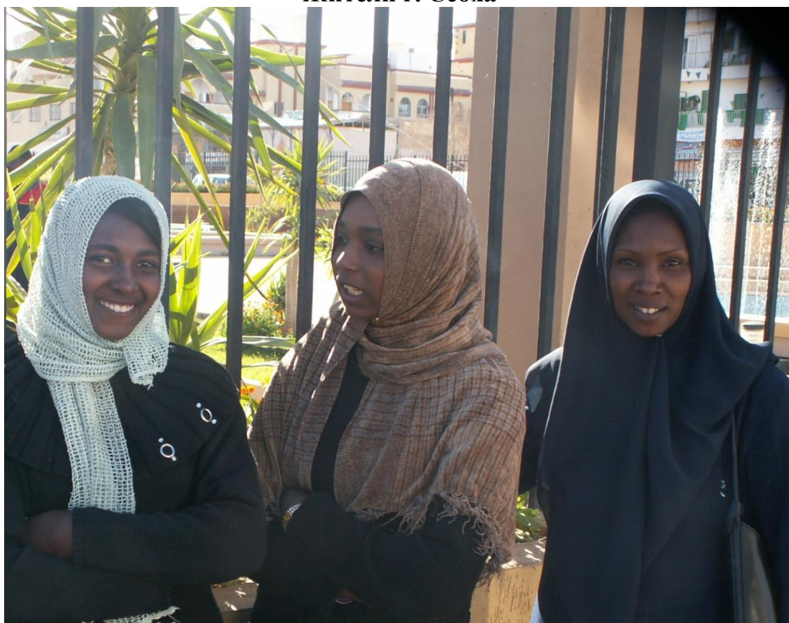
Студентки, г. Себха