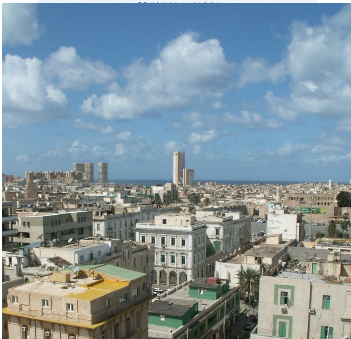
Триполи, вид из окна гостиницы