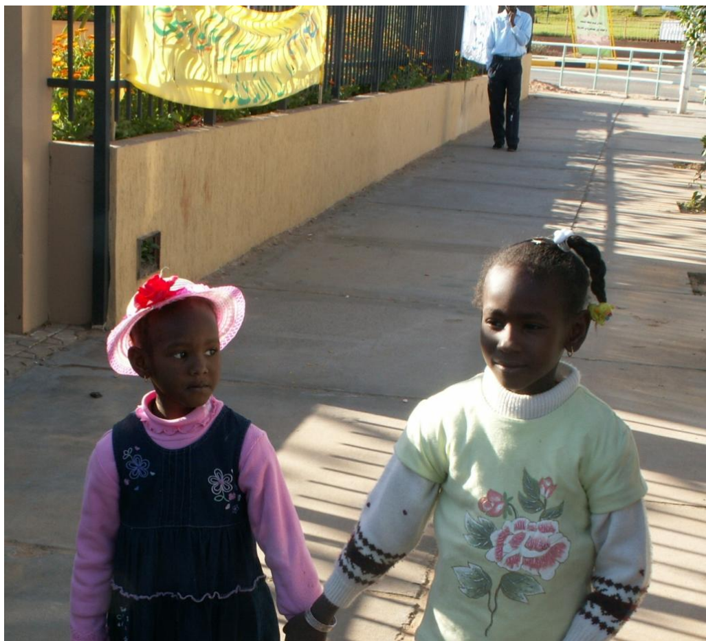
Жители г. Себха