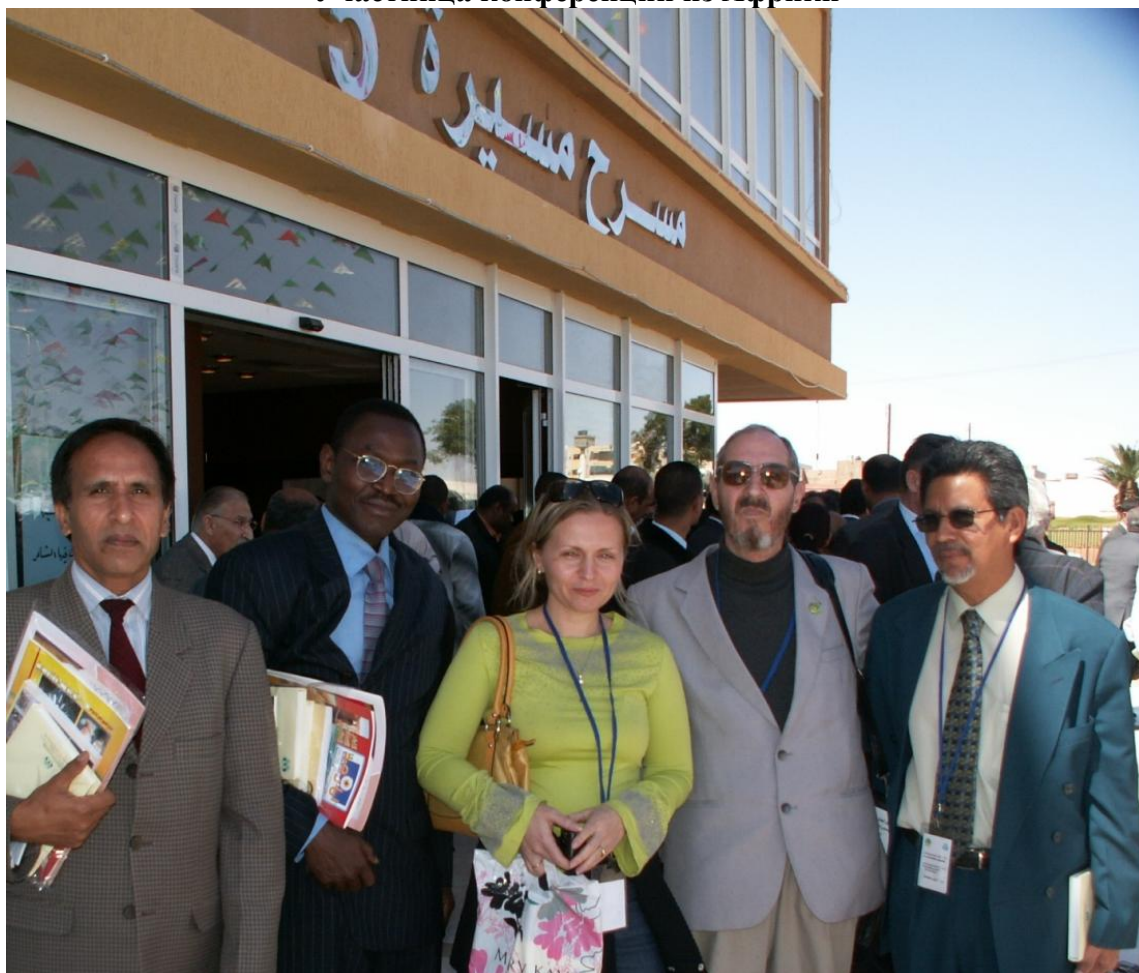
Участники конференции. Справа Карлос Кастанеда (полный теска писателя К.Кастанеды)