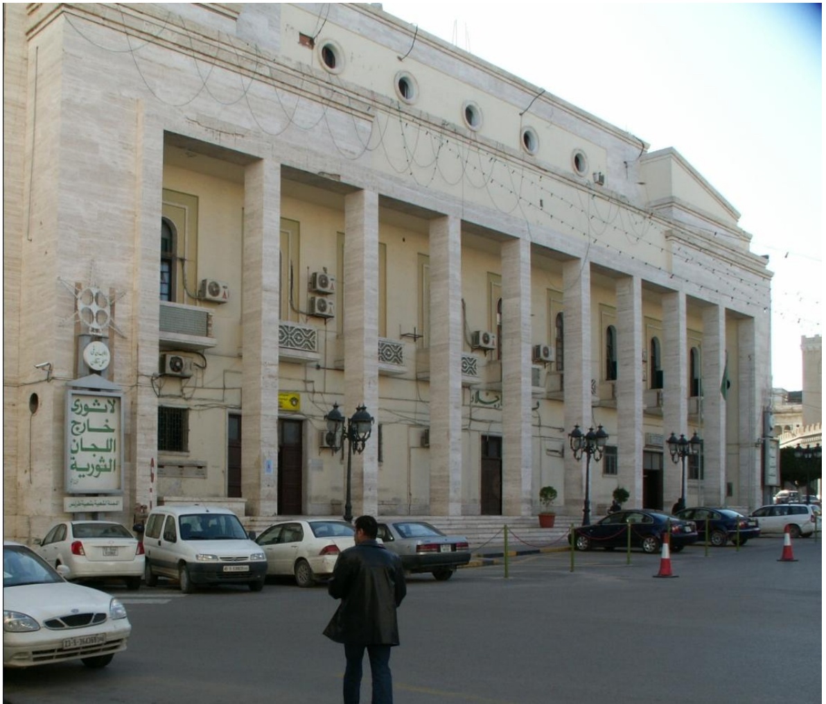
Триполи, здание главпочтамта