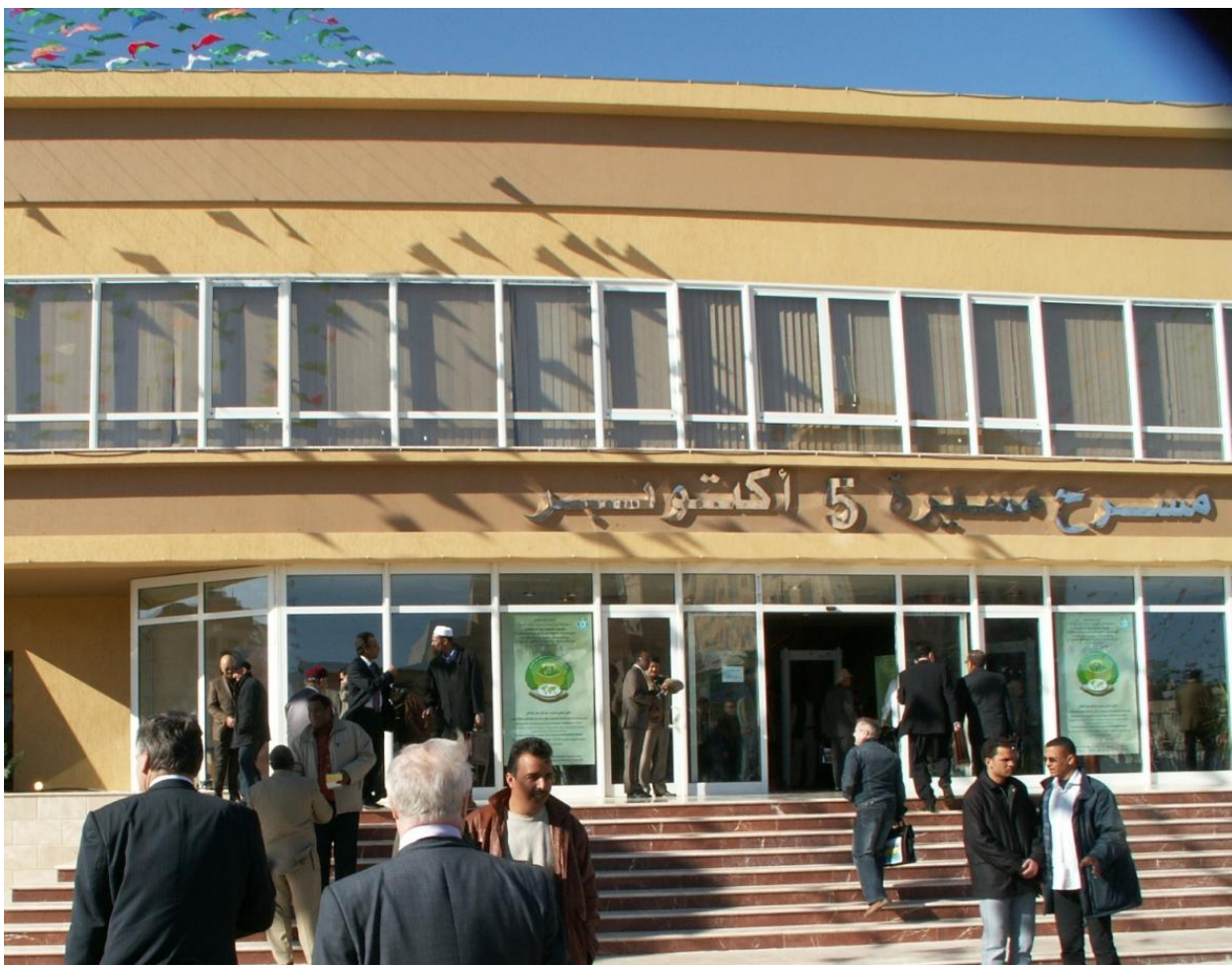
Себха, фасад здания, где проводилась Международная конференция