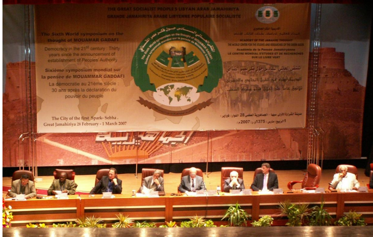
Конференц-зал, где проводилась конференция