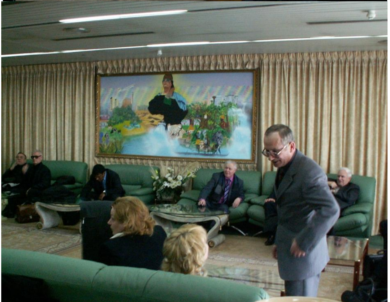
Украинская делегация в комнате отдыха в аэропорту Триполи