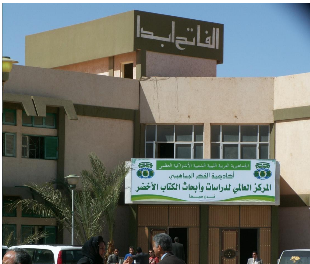
Центр по изучению Зеленой книги