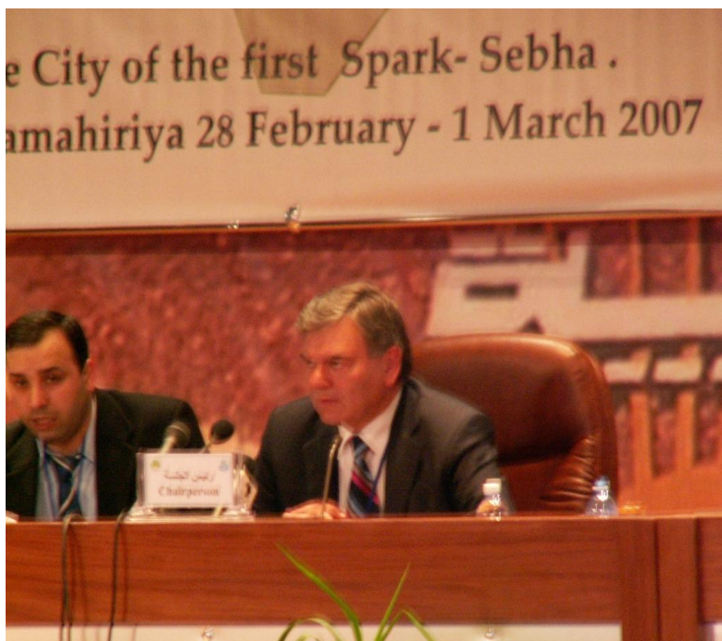
Председательствующий конференции В.Г.Кремень