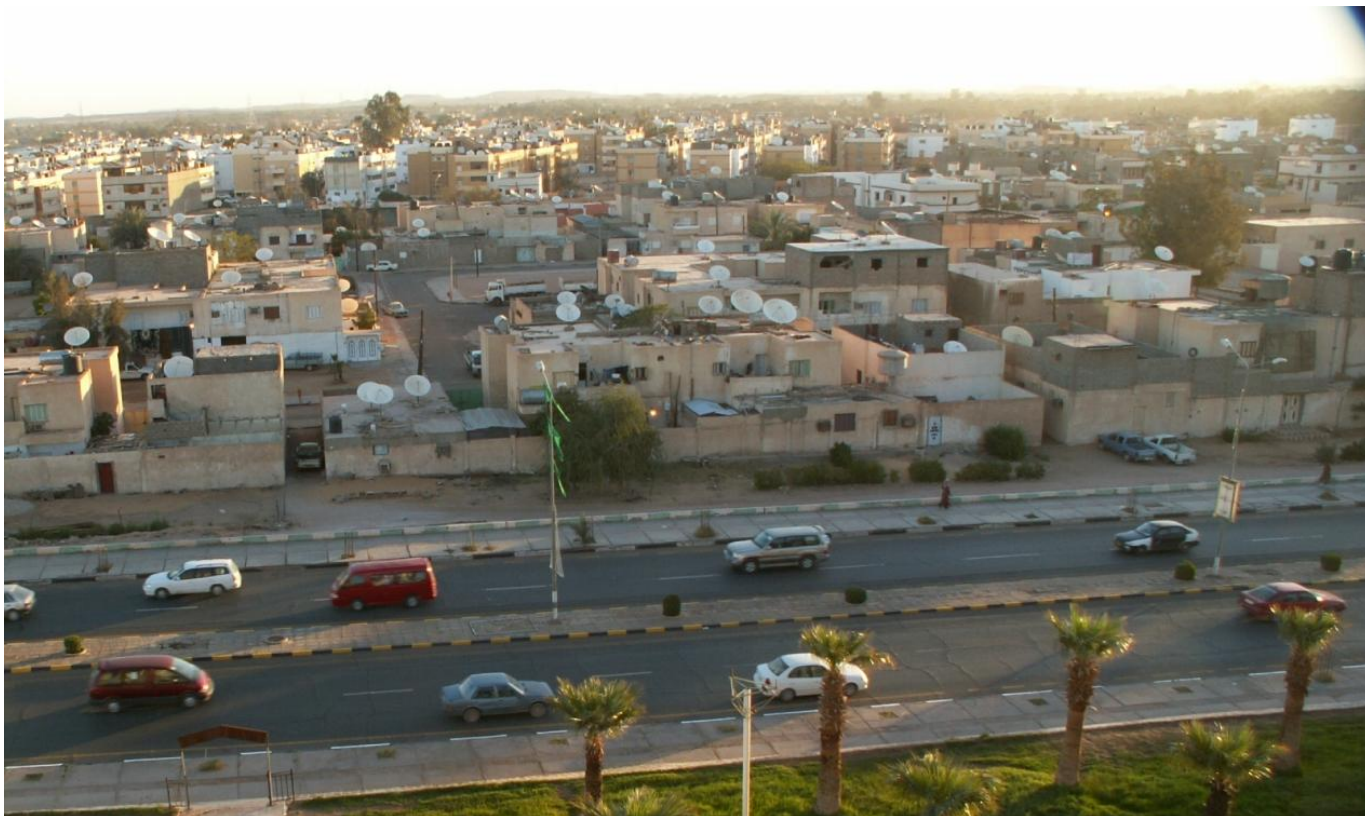
Себха, где проводилась конференция, вид из окна гостиницы