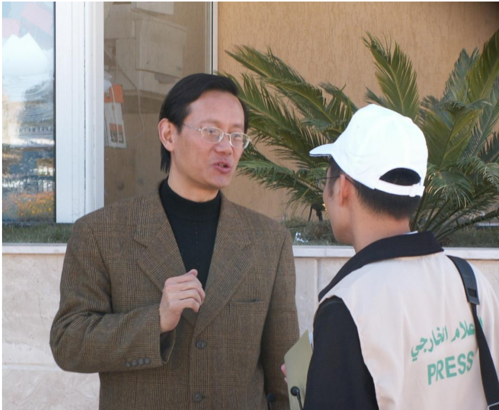
Участник конференции из Китая