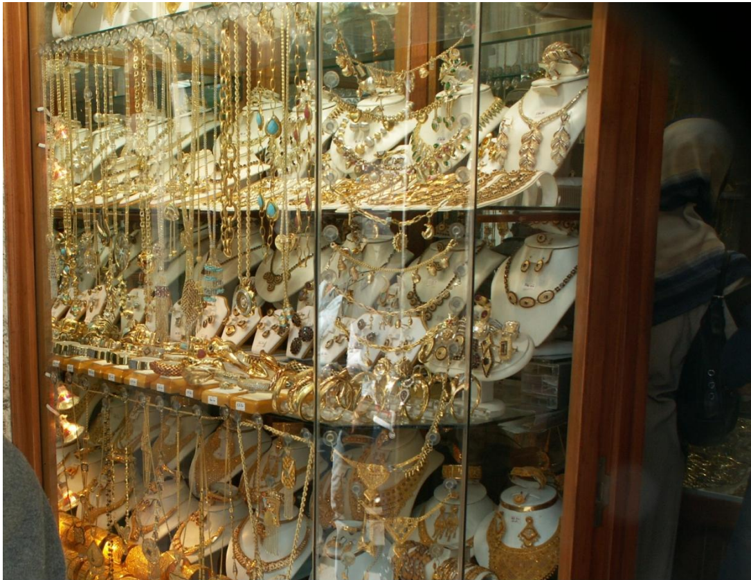
Золотые украшения на восточном базаре Триполи