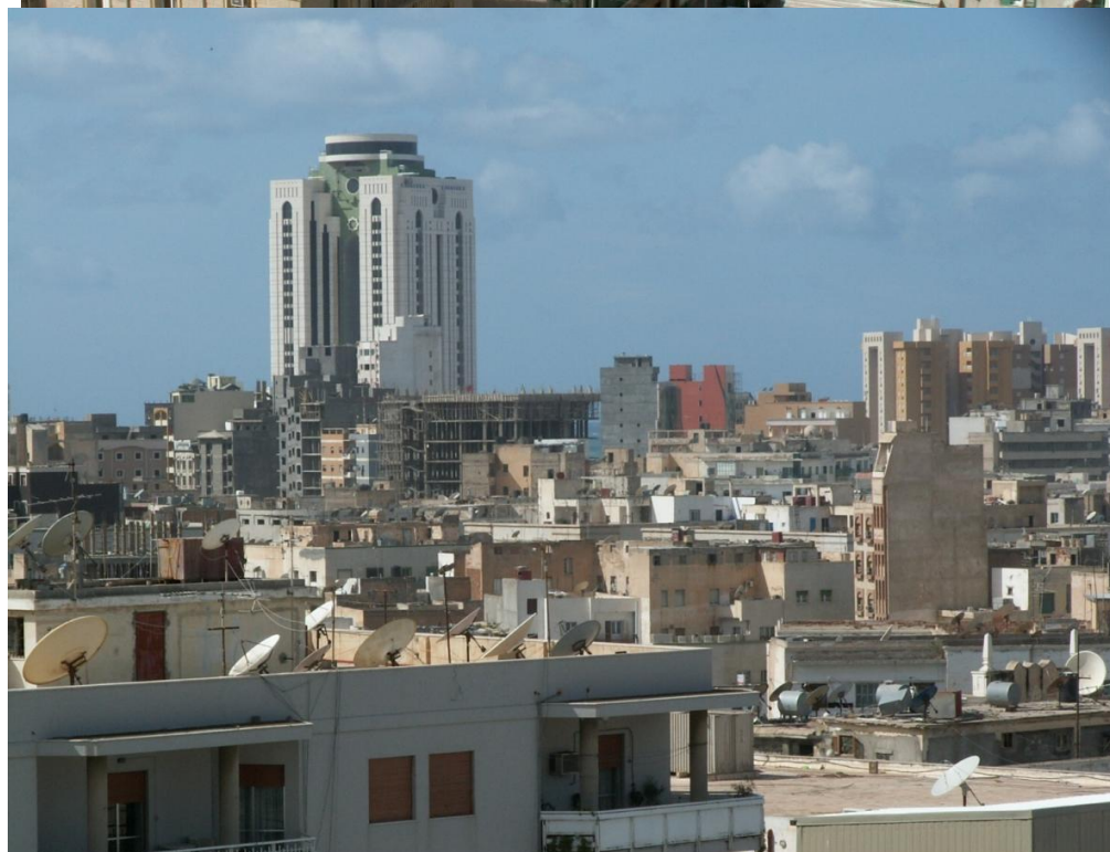
Триполи, панорама из окна гостиницы