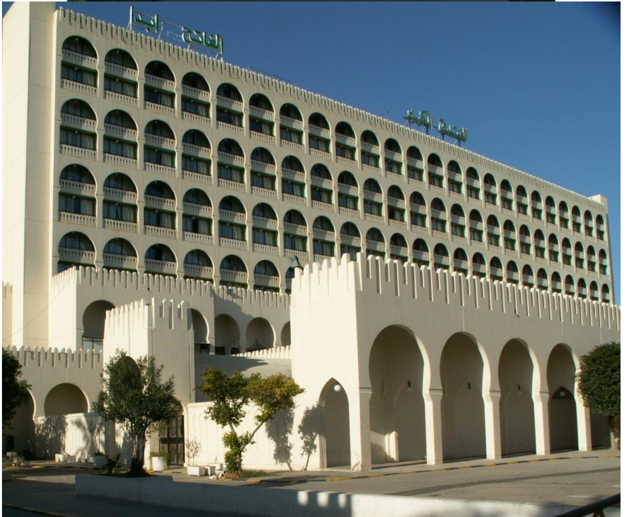
Триполи, пятизвездочный отель, где проживали участники конференции