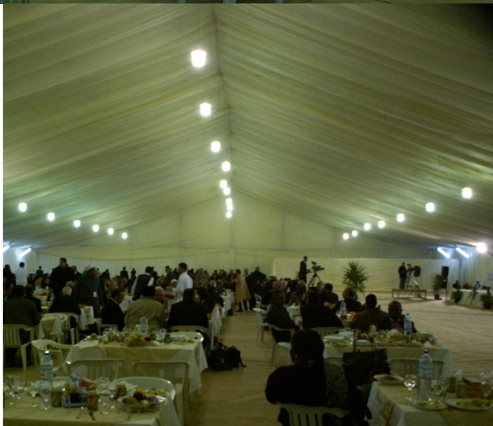
Себха, место ужина участников конференции