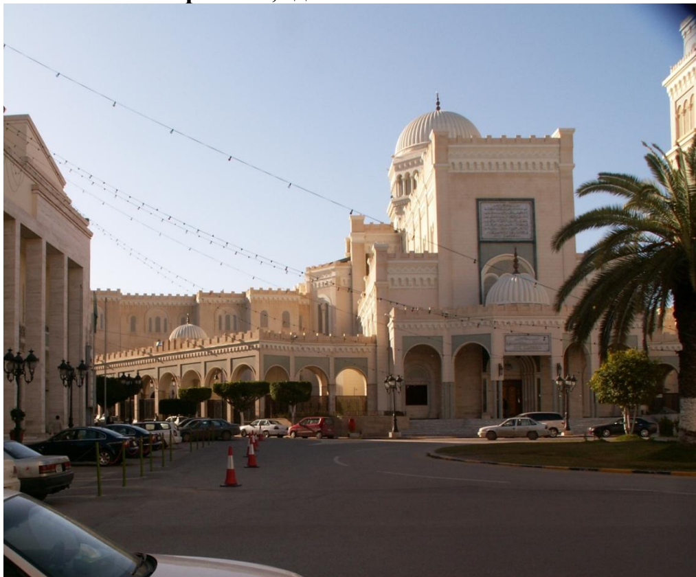
Триполи, площадь, слева здание главпочтамта