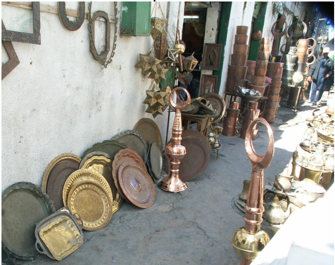
Триполи, восточный базар