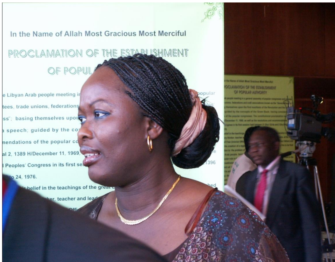
Участница конференции из Африки