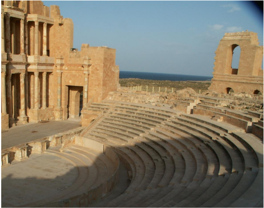
Побережье Средиземного моря, остатки римской истории