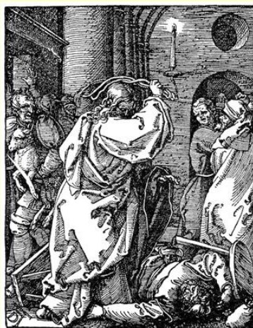
А. Дюрер Изгнание торгующих из храма (ок. 1509)

Возвращаясь к вопросу о времени, напомним, что течение времени определяется движением небесных светил, а в обыденной жизни используется солнечное время.