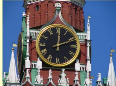
КУРАНТЫ СПАССКОЙ БАШНИ

И при этом именно куранты Спасской башни символизируют для России верное время. Явное мифосимволическое единство куретов и курантов побуждает нас привести весьма показательный словесный ряд: