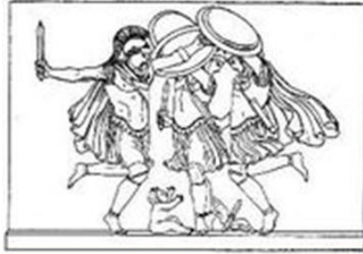
КУРЕТЫ ОХРАНЯЮТ МЛАДЕНЦА-ЗЕВСА